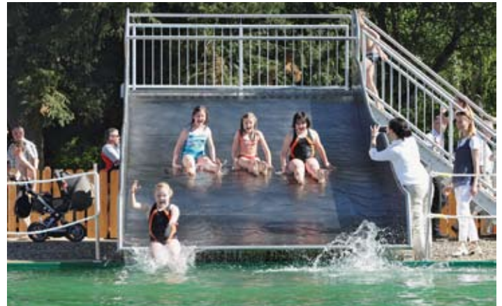
Vor allem die jungen Blankenburger nahmen ihr neues Bad am Thie gleich nach der offiziellen Eröffnung in Beschlag und hatten sichtlich Spaß dabei.