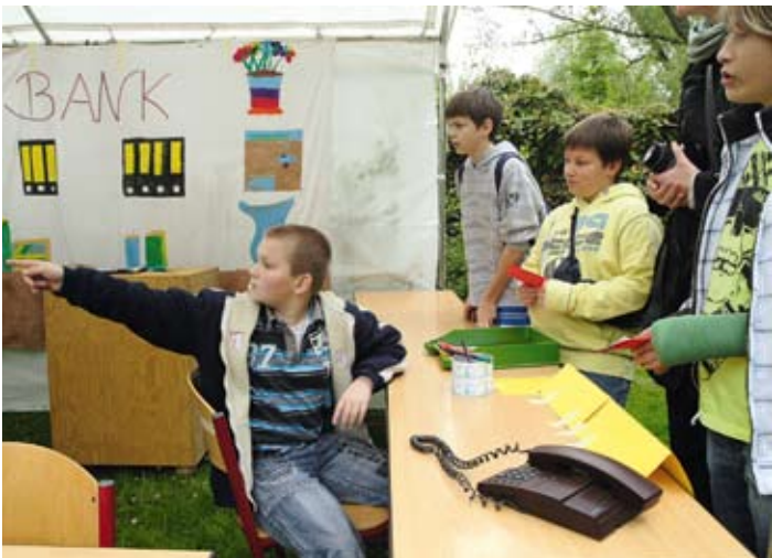
Die Währung in der Kinderstadt, der Quedel, war in der Bank gut aufgehoben. Und Tipps, wo man die redlich verdienten Quedel ausgeben kann, gabs gratis.

In der Kinderstadt haben nur Kinder Zutritt und können sich in der Welt der Erwachsenen ausprobieren. Angefangen von der Jobsuche, dem Arbeiten in verschiedenen Berufen, der Weiterbildung bis hin zur Freizeitgestaltung reichen die vielfältigen Angebote der Kinderstadt.